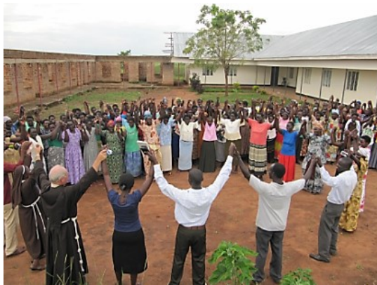
Youfra en Uganda

Dos de los 20 obispos de Uganda frecuentaron como huérfanos escuelas de las „Pequeñas Hermanas“ (Little Sisters). El Episcopado de Uganda está del lado del Papa Francisco. El apoyo a la Hna. Margaret significa también el fortalecimiento de las actividades de todas las entidades franciscanas y sus proyectos. ¡Ella es como un fuego central que hace arder el espíritu franciscano en Uganda!